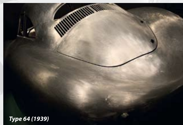
Type 64 (1939)