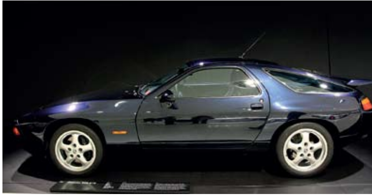
928, Αυτοκίνητο της Χρονιάς (1978)